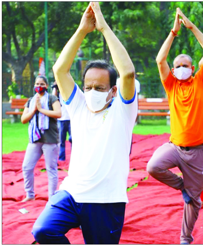
सुरक्षित दूरी रखते हुए योगाभ्यास कर रहे हैं। डॉ. हर्ष वर्धन ने बताया कि योग का उनके हृदय में एक विशेष स्थान है। उन्होंने कहा, वर्तमान महामारी ने यह दिखा दिया है कि स्वास्थ्य सही

उन्होंने कहा कि वैक्सीन का उत्पादन बढ़ने से आगे आने वाले महीनों में वैक्सीन की उपलब्धता बढ़ेगी और निकट भविष्य में और नये वैक्सीन की स्वीकृति मिलने से देश में टीकाकरण की गति बढ़ेगी। उन्होंने सभी को आग्रह किया कि वे स्वीकृत कोविड वैक्सीन के बारे में अफवाह या दुष्प्रचार के छलावे में न आएँ। डॉ. हर्ष वर्धन ने दिल्ली के कश्मीरी गेट स्थित महाराजा अग्रसेन पार्क में 7वें अंतर्राष्ट्रीय योग दिवस के अवसर पर